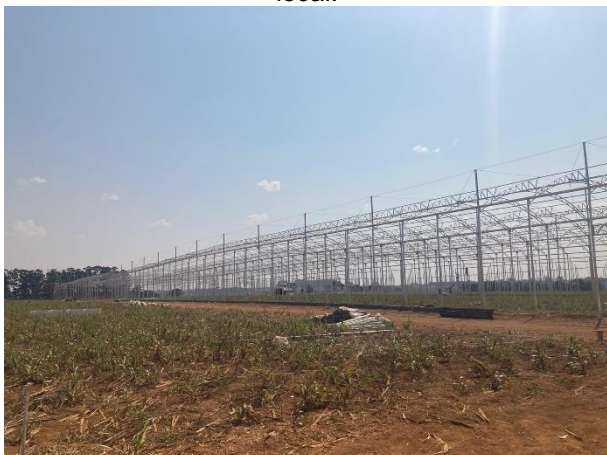
Figura 05: Processo de instalação das estufas no local.