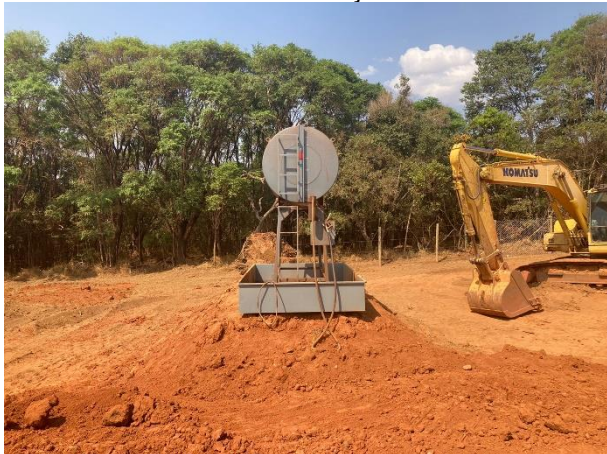
Figura 06: Local de armazenagem de combustível com contenção.