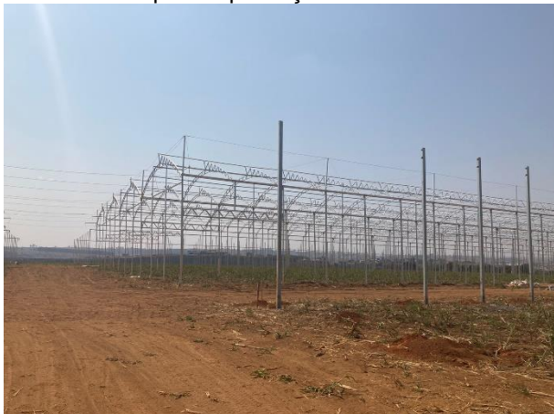
Figura 03: Vista de onde estão sendo construídas as estufas para a produção do alho semente.