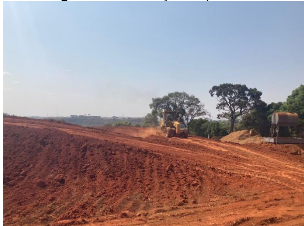
Figura 05: Construção do piscinão.