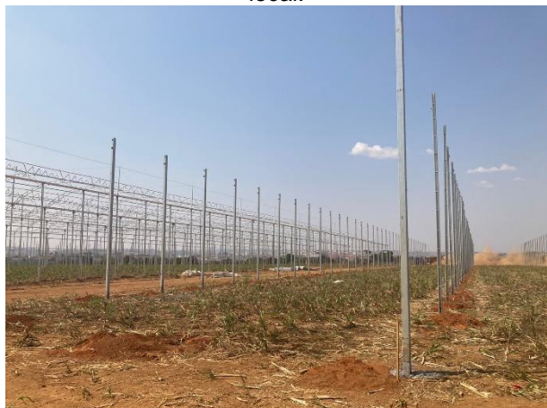
Figura 04: Processo de instalação das estufas no local.