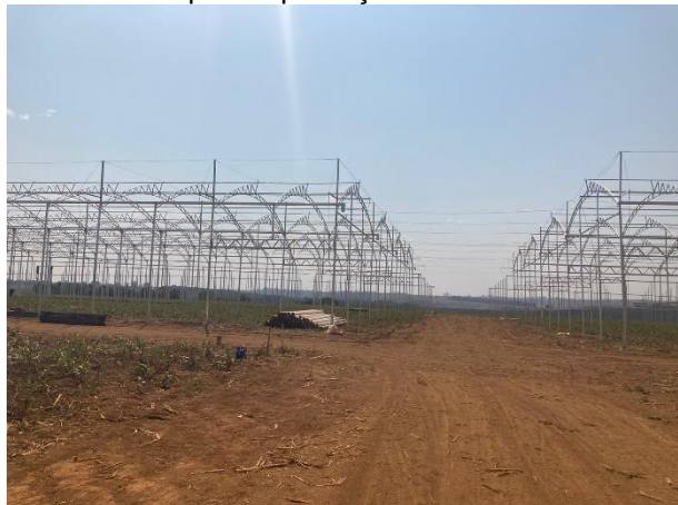
Figura 02: Vista de onde estão sendo construídas as estufas para a produção do alho semente.