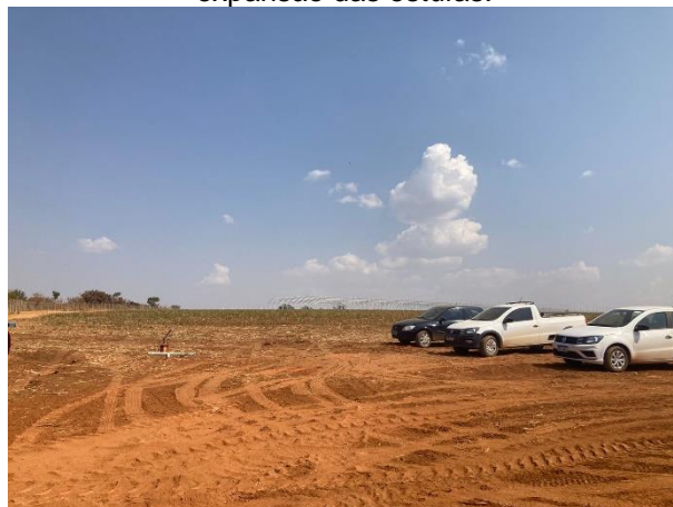
Figura 08: Vista do local onde será feita a expansão das estufas.