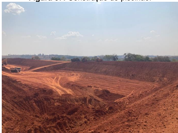
Figura 07: Construção do piscinão.